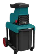
ESH-2825GBL-01 ИЗМЕЛЬЧИТЕЛЬ САДОВЫЙ

220В ~ 50 Гц, 2800Вт, 4500 об/мин . Стальные лезвия, Макс. диаметр резки 45 мм. Контейнер 50 л. Плавный пуск, Защита от перегрузки.