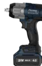
CIW-E2241CB-01 УДАРНЫЙ ГАЙКОВЕРТ

БЕСЩЕТОЧНЫЙ двигатель, Li-Ion 21В 2Ач x1 шт + 4Ач x1шт, 13 мм, 120 Нм, 0-450/0-1800rpm, 0-7000/24000bpm, металлический патрон, Кейс.