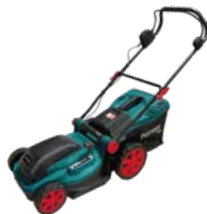
BLM-404-40-BL ГАЗОКОСИЛКА АККУМУЛЯТОРНАЯ

220В ~ 50 Гц, 1800 Вт, Скорость: 400 об/мин, Ширина обработки: 400 мм, Глубина обработк: 220 мм (макс.), Лезвий: 6 шт