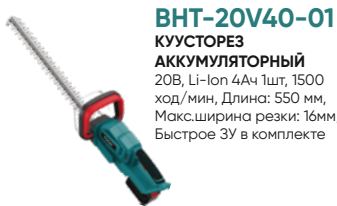
BHT-20V40-01 КУСТОРЕЗ АККУМУЛЯТОРНЫЙ 20В, Li-Ion 4Ач 1шт, 1500 ход/мин, Длина: 550 мм, Макс.ширина резки: 16мм, Быстрое 3У в комплекте