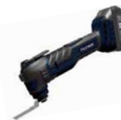
BMT-E20V20C-01 РЕНОВАТОР (МУЛЬТИТУЛ) АККУМУЛЯТОРНЫЙ

220В ~ 50 Гц, 350Вт, 6 скоростей: 15000-21000 кол/мин, Степень колебания 3,6°, Универсальная быстрая смена насадок, Доп.рукоятка, Кейс.