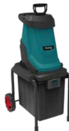
ESH-2800-01 ИЗМЕЛЬЧИТЕЛЬ САДОВЫЙ

2600 Вт. Скорость: 4500 об/мин. Стальные лезвия 3 шт. Макс. диаметр резки: 45 мм. Объем мешка: 45 л. Плавный пуск. Защита двигателя от перегрузки. Блокировка двигателя при заклинивании.